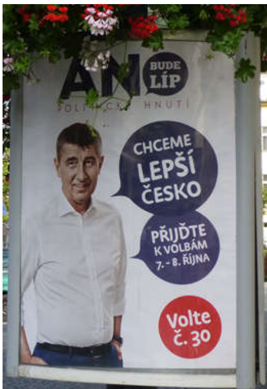
Obrázek č. 2. Vizuál ANO