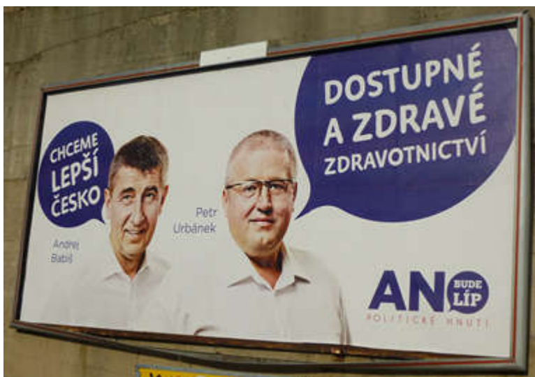
Obrázek č. 3. Vizuál ANO