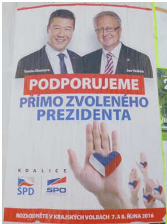
Obrázek č. 5. Vizuál koalice SPD a SPO