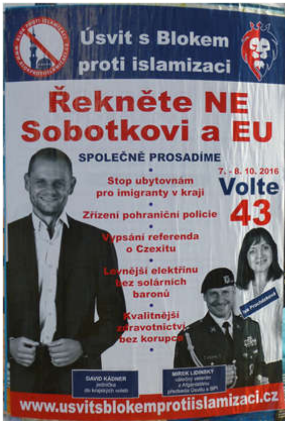
Obrázek č. 4. Vizuál Úsvitu-NK a D-BPI